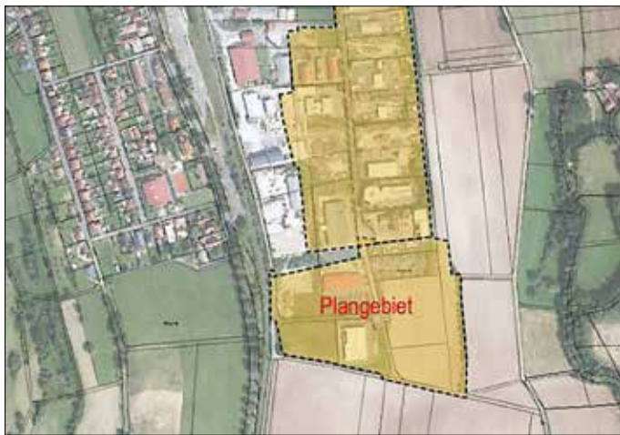
(Abbildung Plangebiet „Untere Röde Teil II“ in Dermbach)

Folgende Grundstücke sind Bestandteil des Geltungsbereiches: Gemarkung Dermbach, Flur 6