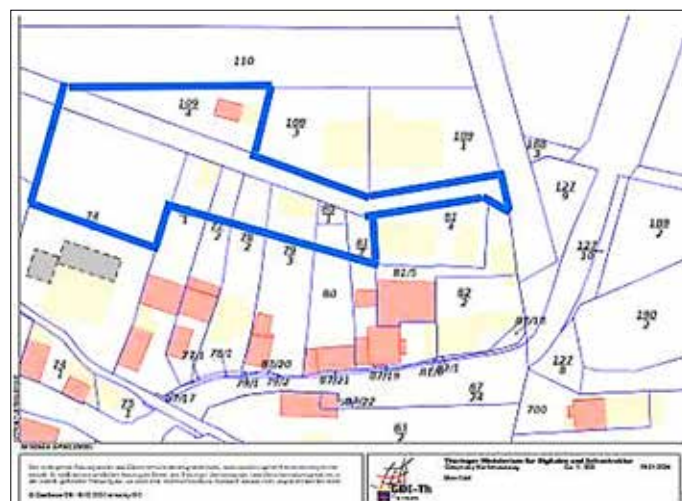
(Geltungsbereich mit der blauen Linie gekennzeichnet)