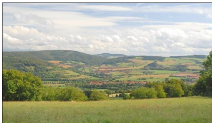
Blick auf den Gläser

Während der Biosphärenwochen bieten die Verantwortlichen in diesem Jahr digitale Höhepunkte - unter anderem einen Wettbewerb, bei dem es genussvolle Preise zu gewinnen gibt. Alle Infos gibt es auf der Homepage des Biosphärenreservats unter www.biosphaerenreservat-rhoen.de .