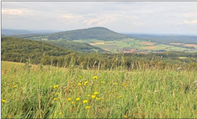
Blick auf den Baier