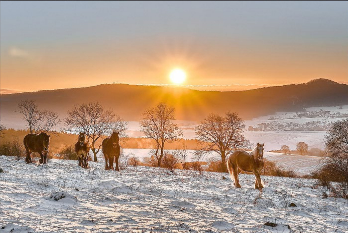
Foto von Mario Kraus aus Dermbach / OT Unteralba, 2. Platz des Fotowettbewerbs „Heimatmomente“