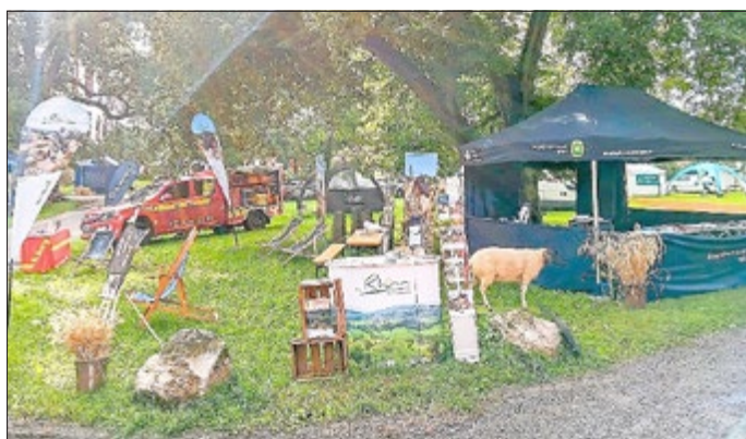
Gemeinschaftsstand von Rhön GmbH und UNESCO-Biosphärenreservat Rhön