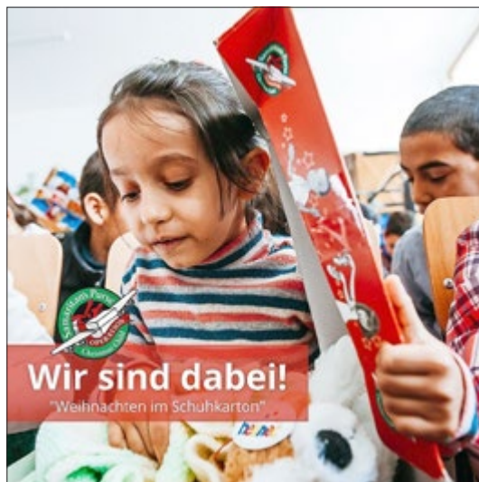
Weltweit wurden in 2022 mehr als 10.559.907 Kinder mit einem Schuhkarton beschenkt.

Jeder kann ein Päckchen packen Die Geschenkaktion „Weihnachten im Schuhkarton“, der christlichen Hilfsorganisation Samaritan's Purse startet wieder im Oktober. In diesem Jahr können die gepackten Schuhkartons zwischen dem 6. - 13. November in der Diakonie Sozialstation Dermbach und in der Bibliothek Dermbach abgegeben werden. „Weihnachten im Schuhkarton“ ist eine internationale Geschenkaktion und erreicht jährlich Kinder in über 100 Ländern. Die Idee ist einfach: Packt einen Schuhkarton mit Geschenken für bedürftige Kinder und bringt damit ein Lächeln in ihre Gesichter. Alle Informationen finden Sie unter: https://www.die-samariter.org/projekte/weihnachten-im-schuhkarton/ oder in den Flyern, die in den Annahmestellen bereit liegen.